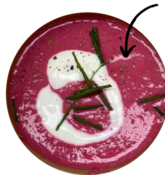
Crema de remolatxa

Per entregues fora d'aquestes poblacions demanar pressupost