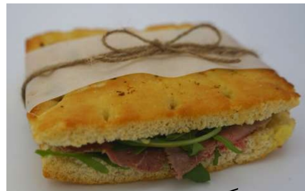
Focaccia de roast beef