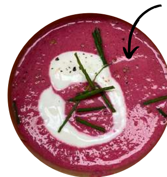
Crema de remolatxa

Per entregues fora d'aquestes poblacions demanar pressupost